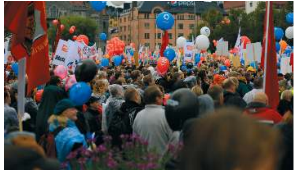
Hallituksen vastainen mielenosoitus Helsingissä 2015.

VASTARINTAKUVA TÄLLÄ PALSTALLA JULKAISTAAN KULUVAN KVARTAALIN VASTARINTAKUVA.