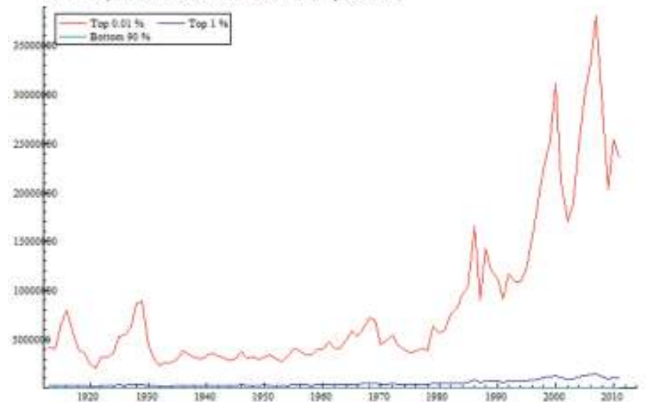
Kuva 1. Yhdysvaltalaisien keskimääräiset tulot vuosittain (sis. pääomatulot)

Kun tämä yhdistetään rahoitusmarkkinoiden vapauttamiseen 70-luvulla ja sitä seuranneeseen rahoitusmarkkinoiden volyymin valtaavan kasvuun, jota jyrkät heilahdukset ovat välillä vavisuttaneet, näyttää olevan tarpeeksi syytä alustavan eliittihypoteesin muotoiluun: