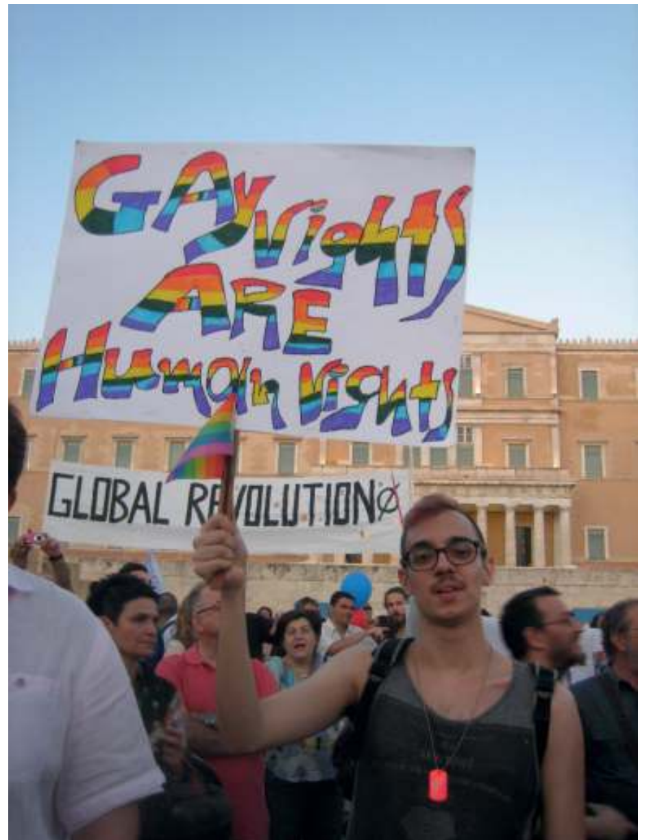
Ateenan Gay Pride- ja Alter Summit -kulkueet kohtasivat Kreikan parlamenttitalon edustalla 8.6.2013.

VASTARINTAKUVA TÄLLÄ PALSTALLA JULKAISTAAN KULUVAN KVARTAALIN VASTARINTAKUVA.