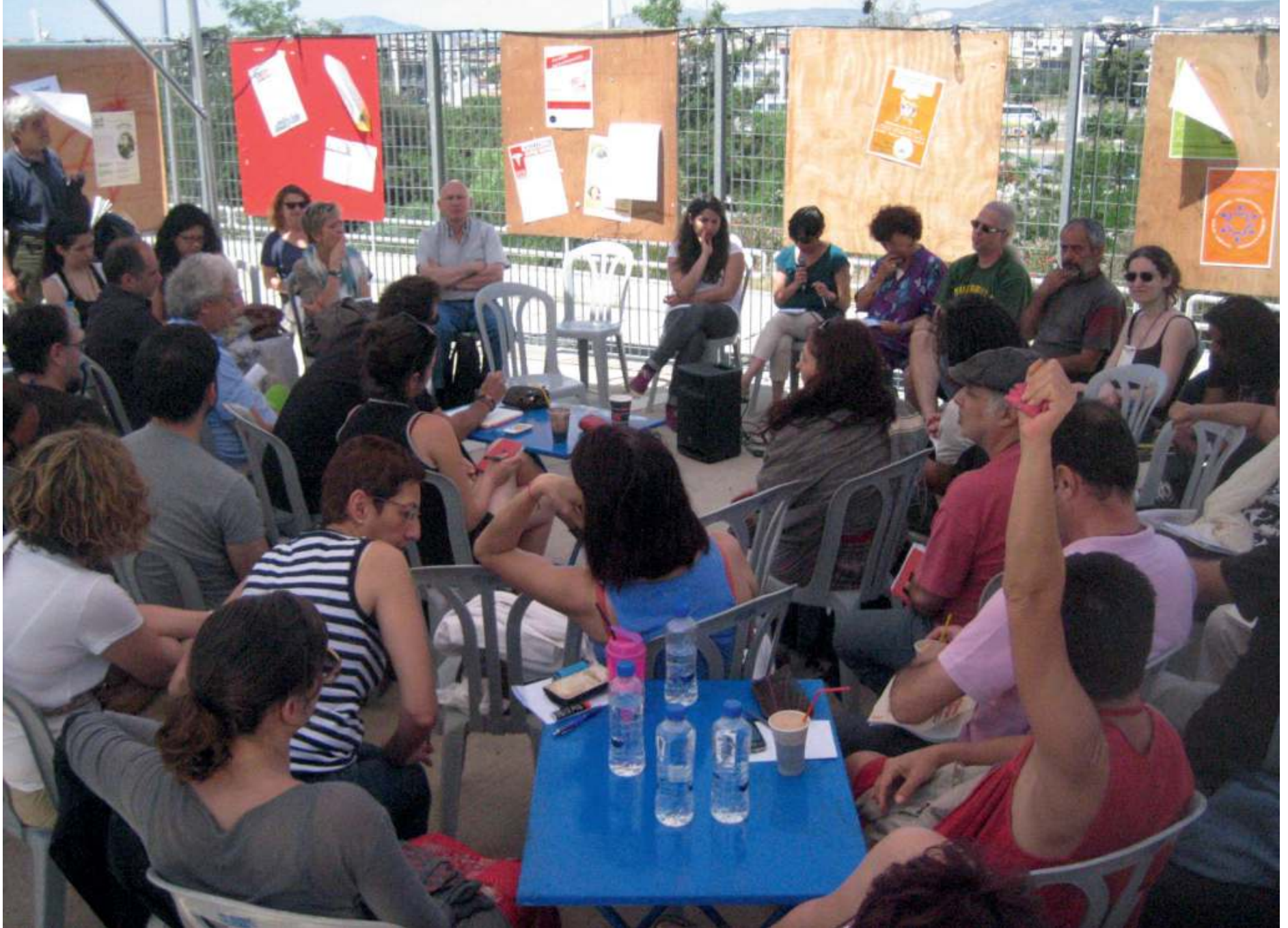
Solidaarisuusaktiivit kerääntyivät teltan alle keskustelemaan suojaa paahavalta auringolta.

samaa kuin Ison-Britannian Big Society -mallissa – sillä erotuksella, ettei Kreikassa edes väitetä, että ihmisille siirtyisi vastuun lisäksi valtaa tai resursseja toiminnan toteuttamiseen. Solidaarisuusverkostoissa tietoisuus tästä problematiikasta vaihtelee. ”Kaikki solidaarisuusrakenteet väittävät, ettemme tee asioita valtion puolesta – tosiasiaa me olemme luomassa uutta hyvinvoinnin järjestelmää!” huudahtaa yhdessä verkostossa toimiva mies.