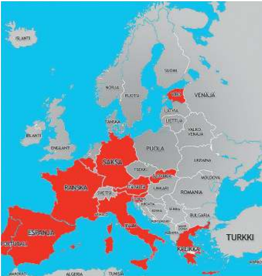
Transaktioverossa mukana olevat 11 maata.

rahoitusmarkkinaveron synnyttämiseksi oli sen tulojen kanavoiminen suoraan unioniin budjettiin. Se osoittautui poliittisesti mahdottomaksi. Jäsenmaat eivät hyväksyneet komission ehdotusta unionin veronkanto-oikeudesta, ei edes vastineeksi jäsenmaksuhelpotuksista.