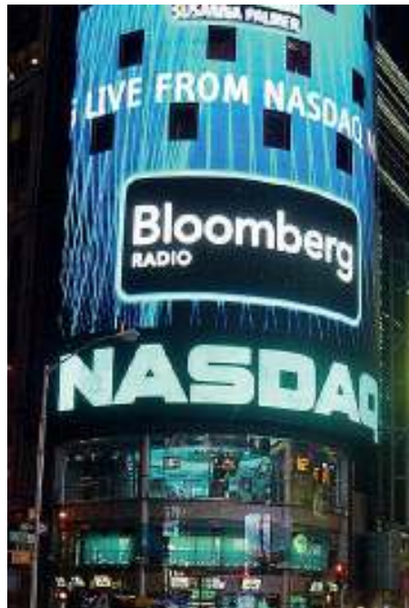
Hyvinvointi pörssiin?

sektorin paikallissidonnaisuus, yritysrakenteen kehittämättömyys verrattuna tavaroiden kauppaan, sääntelyn laajuus ja kilpailun puute. Näihin ongelmiin vapaakauppasopimuksilla ja uudella hankintadirektiivillä puututaan. Niillä luodaan uutta arvoa palveluista, kuten ET-LAnkin viimevuotisessa julkaisussa kehoitetaan tekemään.