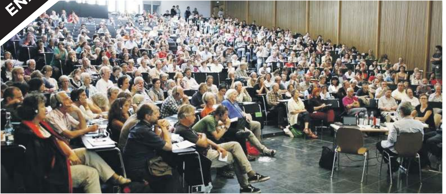
Satoja ihmisiä kerääntyi kuuntelemaan plenaareja.