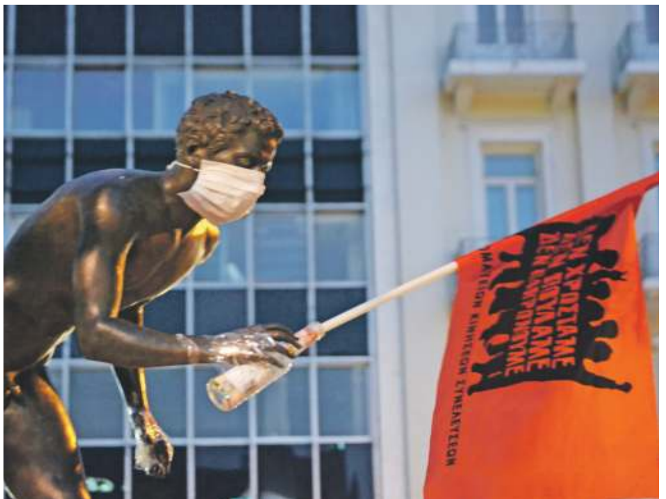
Myös patsaat liittyivät protesteihin demokratian kehtona tunnetussa Kreikassa.