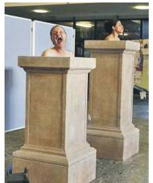
Asiaohjelman lomassa nähtiin useita kulttuurispektaakkeleita.

Toimivia kokeiluja löytyy – joissakin tapauksissa jopa sellaisia, joissa pyritään ottamaan käyttöön vaihtoehtoja nykyiselle rahalle.