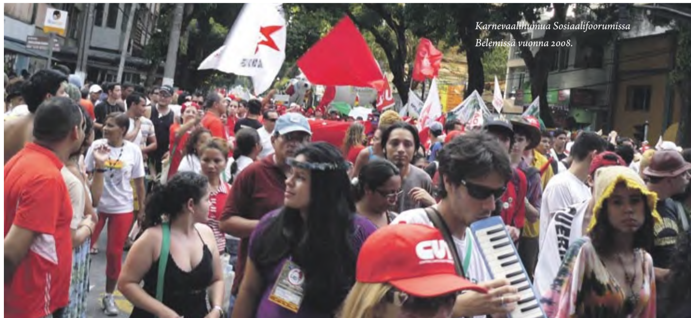
Karnevaalimua Sosiaalifoorumissa Belemissä vuonna 2008.