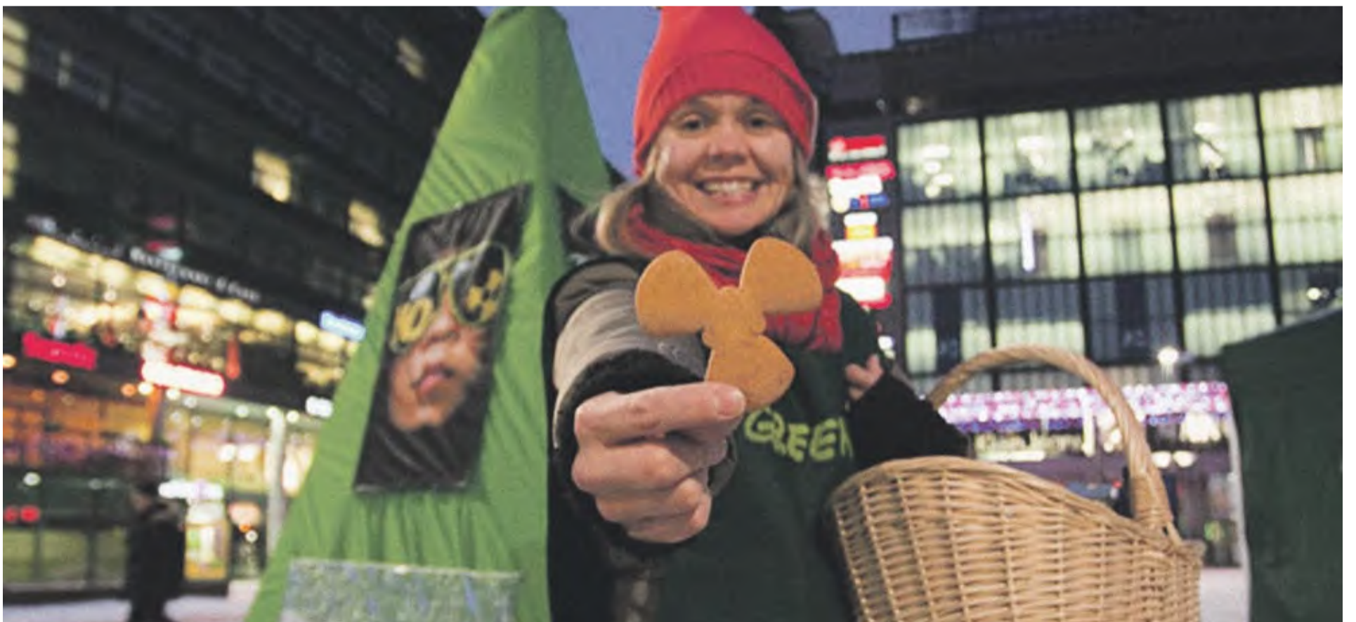
Säteilekö joulupöydässäsi? Greenpeacen Säteilevää joulua -kampanjassa elintarvikealan jättejä rohkaistaan luopumaan Fennovoimaan sijoitetuista osakkeistaan. Uutta ydinvoimaa ovat rahoittamassa muun muassa Atria, Myllyn Paras, Valio Kesko ja SOK.

Ehdotuksia kvartaalin vastarintakuvaksi voi lähettää osoitteeseen hiekanjyvät@gmail.com .