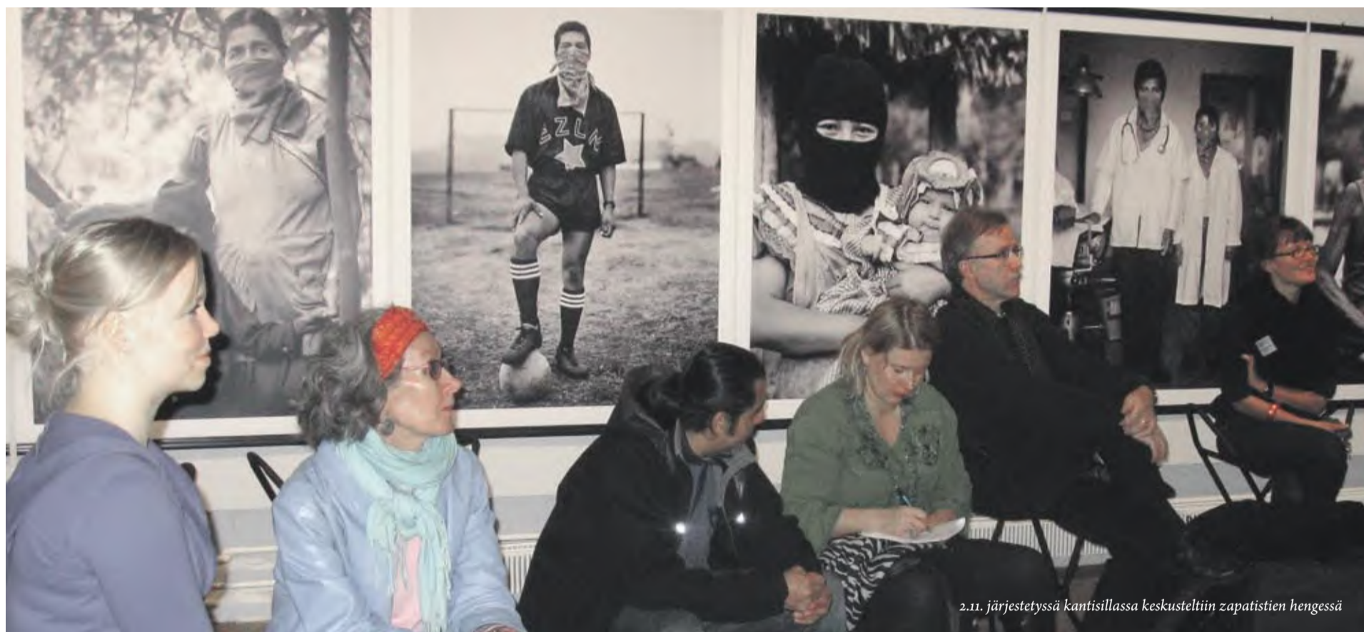
2.11. järjestetyssä kantisillassa keskusteltiin zapatistien hengessä