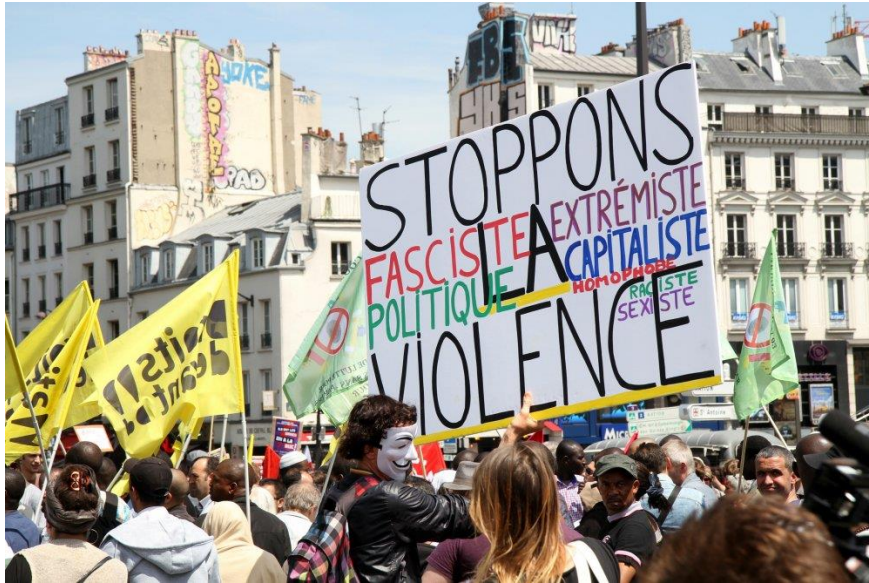
Mielenosoitus Marine Le Penin ehdokkuutta vastaan

Attac: Macronilla on suuri vastuu äärioikeiston etenemisestä: toisaalta toistamalla ministeriensä kanssa äärioikeiston teemoja ja toisaalta lisäämällä eriarvoisuutta ja vahvistamalla sosiaalista epäoikeudenmukaisuutta viisivuotiskautensa aikana.